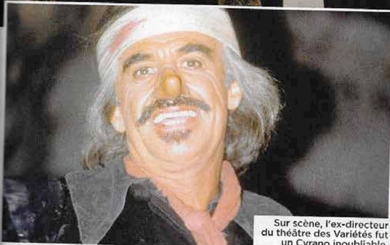
Sur scène, l'ex-directeur du théâtre des Variétés fut un Cyrano inoubliable.